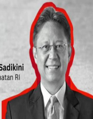
Budi Gunadi Sadikini Menteri Kesehatan RI

"Saya sangat kaget bahwa ternyata banyak anak-anak di dunia, termasuk Indonesia , yang terkena diabetes sejak kecil . Jika tidak diobati dengan cepat, diabetes ini bisa berakibat fatal ."